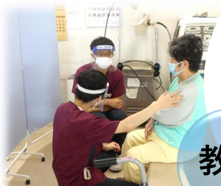
相談前に気付ける関係性