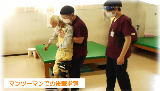
マンツーマンでの後輩指導