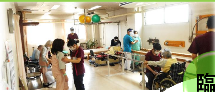
一人一人に合わせた丁寧なプログラムの実践

「臨床」回復期、一般、外来、緩和ケアにて、多様な障害を有した患者さまに対し、エビデンスを意識した確かなリハビリテーションを実践しています。退院支援だけでなく、退院後の安心を提供できるように日々患者さまと寄り添いながら臨床に励んでいます。