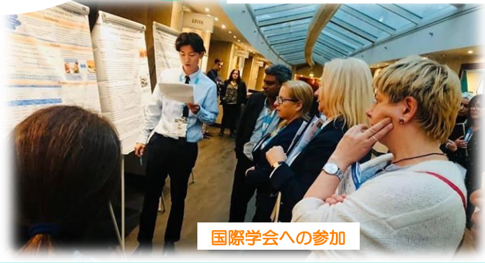
国際学会への参加

「教育」『理解できるまで』が基本の指導方法として、チーム内で偏りのない指導を実践しています。OJTや勉強会など意欲的に実施しており、入職後の新人研修も充実しています。外部講師による実地研修や個別指導も定期的実施しており、スタッフの育成にも力を入れています。