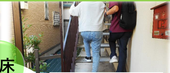
患者さまのニーズに合わせた退院支援